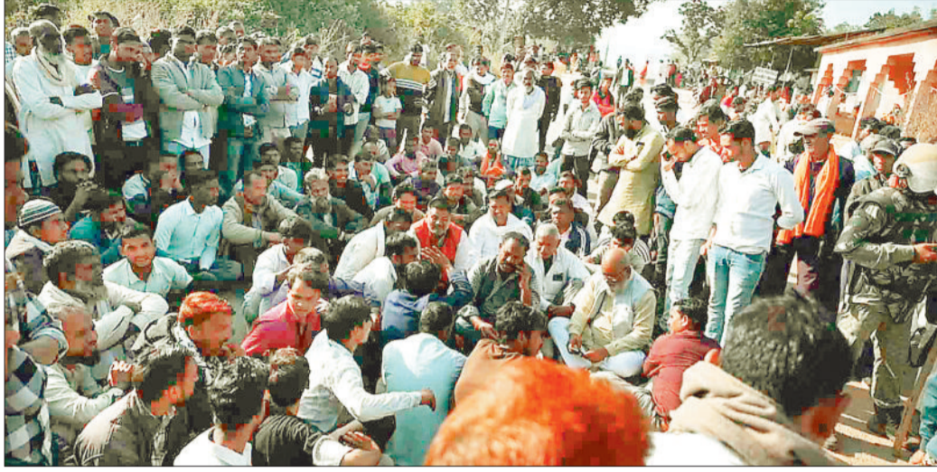
विरोध प्रदर्शन करते ग्रामीण।

रामचन्द्रपुर पुलिस थाना के निकट संचालित कन्या छात्रावास से सटी शासकीय भूमि विशेष समुदाय के 9 परिवार लम्बे समय से घर बनाकर रह रहे हैं। मंगलवार को सुबह तहसीलदार के नेतृत्व में प्रशासनिक अमला पुलिस बल एवं जैसीबी लेकर पहुंचा एवं ग्रामीणों को तत्काल अपना सामान बाहर निकालने तथा अवैध अधिग्रहण को हटाने का निर्देश दिया। प्रशासनिक अधिकारियों एवं पुलिस बल की घेराबंदी से परेशान ग्रामीण कुछ घर पाते कि टीम ने घरों को ढहाना शुरू कर दिया। प्रशासनिक कार्रवाई से अतिक्रमणकारियों में अफरा-तफरी की स्थिति निर्मित हो गई। प्रशासनिक टीम 3 घरों को ढहा पाई थी कि बड़ी संख्या में ग्रामीण स्थल पर पहुंच गए तथा प्रशासनिक कार्रवाई का विरोध करने लगे। ग्रामीणों ने प्रशासनिक कार्रवाई का विरोध करते हुए मुख्य मार्ग पर चक्का जाम