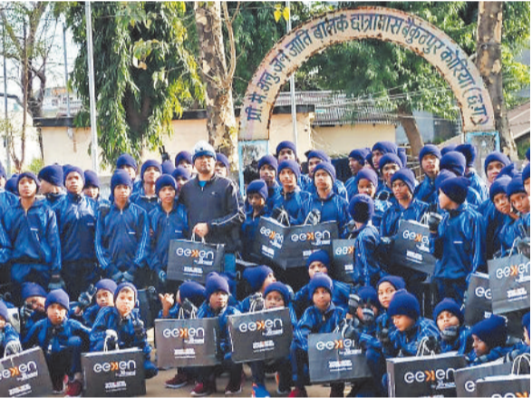
बांटे गए गर्म कपड़े।