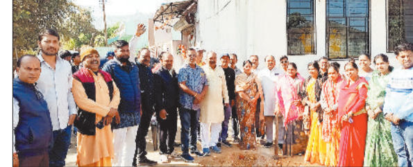
भूमिपूजन करती नपाध्यक्ष।

दंडनीय अपराध है। छग सात राज्यों की सीमाओं से घिरा राज्य है, जहां राष्ट्रीय राजमार्ग गुजरते हैं। अंतर्राज्यीय आवागमन के कारण अवैध पशु परिवहन की घटनाएं होती हैं। ऐसे में जब एवं निराश्रित गौवंश के संरक्षण के लिए गौधाम योजना अत्यंत महत्वपूर्ण है। गौधाम राजमार्ग के समीप ग्रामीण क्षेत्रों में स्थापित पंजीकृत गौशालाओं से भिन्न होंगे, इन्हें राजमार्ग के समीप ग्रामीण क्षेत्रों में स्थापित किया जाएगा। केवल निराश्रित, घूमंतू तथा अधिनियम के तहत जब गौवंश को ही यहां रखा जाएगा। गौधाम के लिए वहीं शासकीय भूमि चर्चाने होगी जहां पानी, बिजली, शेड और सुरक्षा की सुविधाएं उपलब्ध हों। यदि चारागाह भूमि उपलब्ध हो तो हरा चारा उत्पादन का कार्यक्रम संचालित किया जाएगा।