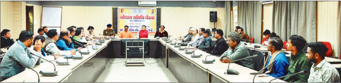
जिला एवं ब्लाक गौधाम समिति के सदस्यों की बैठक लेती कलेक्टर।